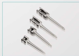
长 / 短臂, 单轴 / 万向螺钉